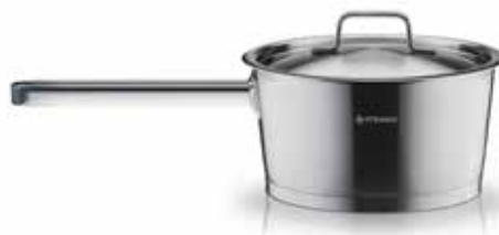
Γαλατιέρα Steel Line