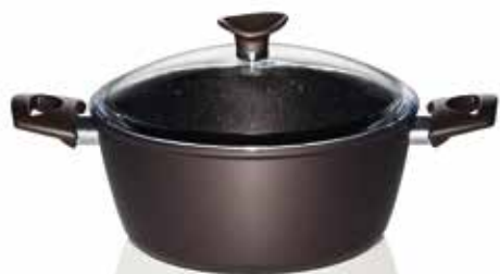
Χύτρα Stone Chef