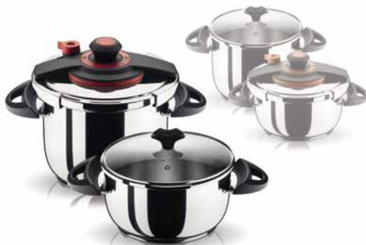
Σειτ Χύτρας Ταχύτητας Optimum Plus 2+2