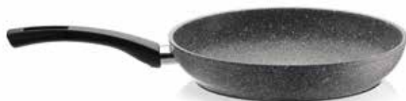
Τηγάνι Grey Force