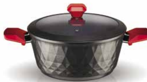
Χύτρα Red Diamond