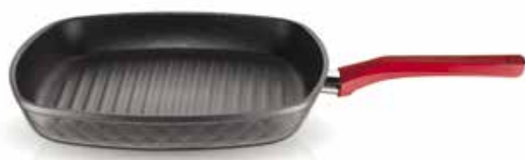
Γκριλιέρα Red Diamond