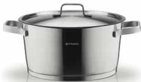
Χύτρα Steel Line