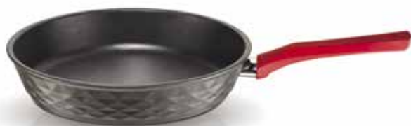
Τηγάνι Red Diamond