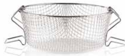
Καλάθι (προσαρμόζεται σε χύτρα Ø24)