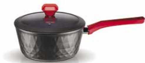
Γαλατιέρα Red Diamond