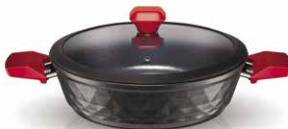
Σοτζά Red Diamond