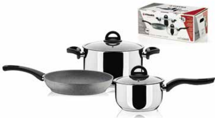
Σετ Mixcook (3+2 τεμάχια)

Η PYRAMIS διατηρεί το δικαίωμα αλλαγής των μοντέλων και τιμών χωρίς καμία προειδοποίηση