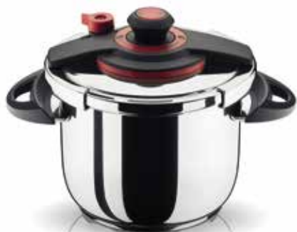
Χύτρα Ταχύτητας Optimum Plus