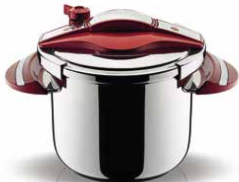
Χύτρα Ταχύτητας Chroma