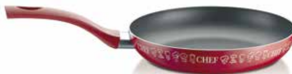
Τηγάνι Olympia Trendy