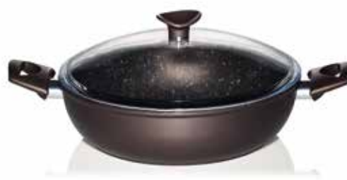
Σοτέζα Stone Chef