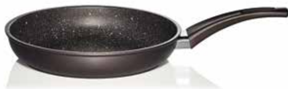
Τηγάνι Stone Chef