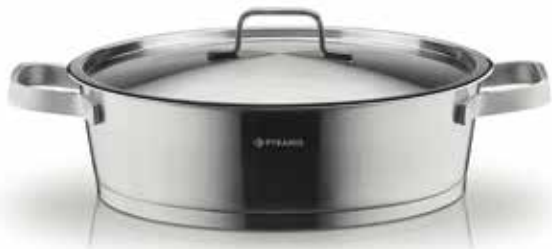
Σοτέζα Steel Line